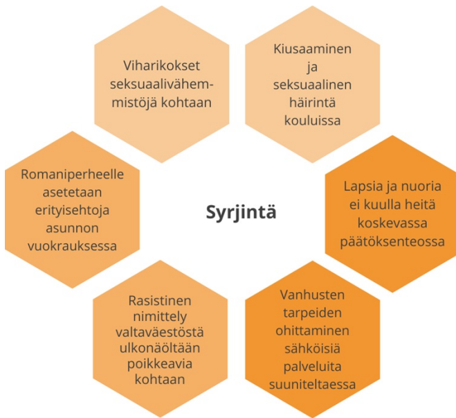
Kuva 2. Esimerkkejä eri väestöryhmien kohtaamasta syrjinnästä (mukaiillen Oikeusministeriö).