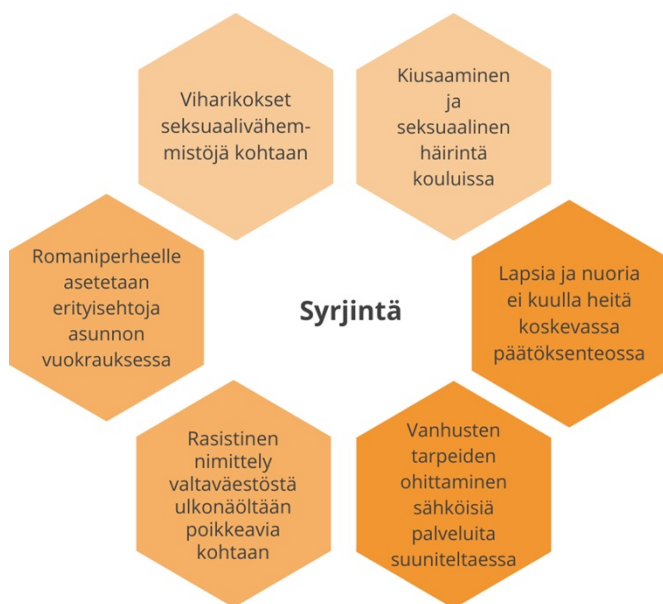
Kuva 2. Esimerkkejä eri väestöryhmien kohtaamasta syrjinnästä (mukaiillen Oikeusministeriö).